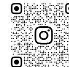
SHIMIN_FUKUSHI 公式 Instagram