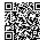
メールマガジン登録