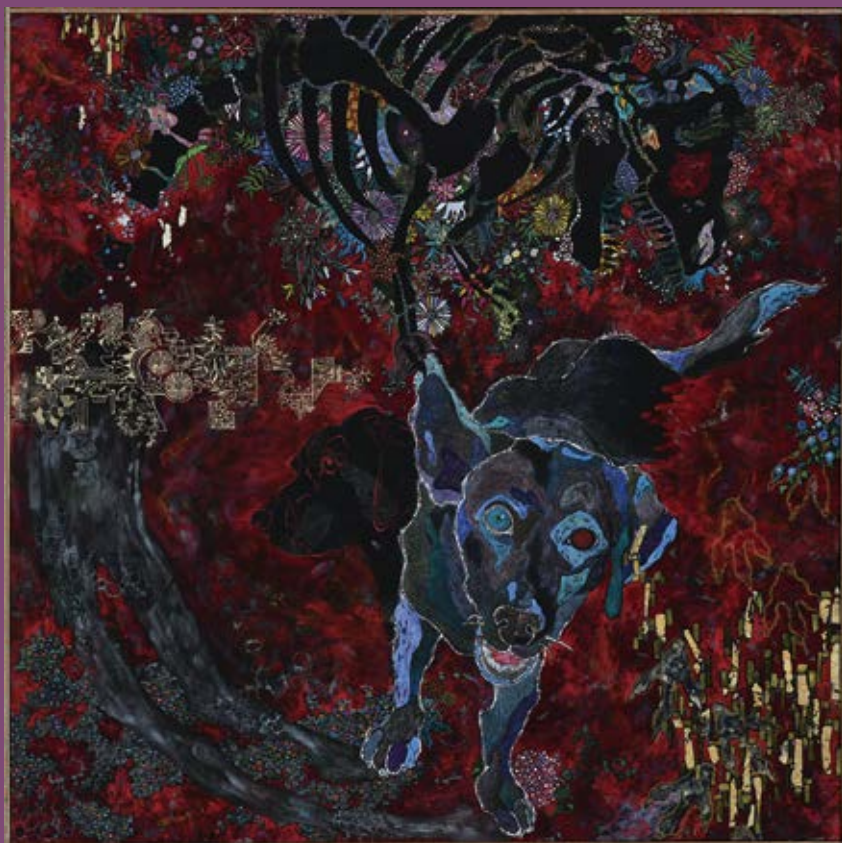
HUG+展2021最優秀賞作品「カンナインフェルノ」祐加

神戸市内の障がい者を対象に絵画・書・写真・陶芸・織物などの作品を公募し、応募いただいたすべての作品を展示します。みなさんのご応募をお待ちしています！