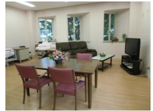
家庭的なお部屋です

少人数で、お一人おひとりに合った個別対応をさせて頂いております。 ゆったりとした雰囲気の中、歌をうたったり、おやつ作りや 園芸、散歩、外出、手芸などをお楽しみ下さい。