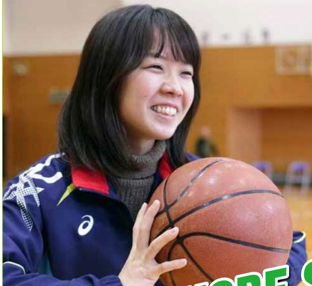
障がい者スポーツを笑顔でサポート