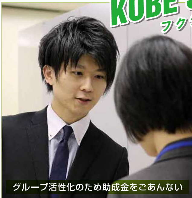
グループ活性化のため助成金をごあんない