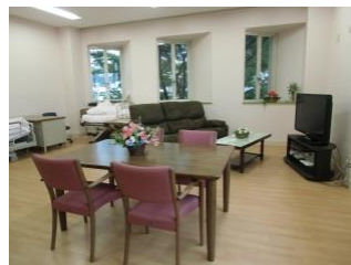
家庭的なお部屋です

少人数で、お一人おひとりに合った個別対応をさせて頂いております。 ゆったりとした雰囲気の中、歌をうたったり、おやつ作りや 園芸、散歩、外出、手芸などをお楽しみ下さい。