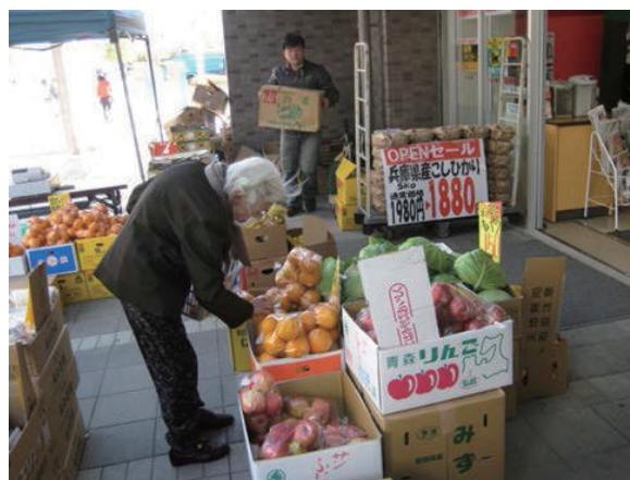
新たに誘致したコンビニの様子

「高齢者の閉じこもり」という福祉課題だけにとらわれず、福祉の視点を持って「まちづくり」を考えたことで、高齢者に配慮された新しい店舗の誘致という最良の結果につながった。