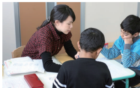
「はいず」での学習の様子

『はいず』には同じルーツを持つ友達がいる、同じ言葉で話せる大人がいるということで、子ども達は週1回『はいず』に通うのを楽しみにしている。