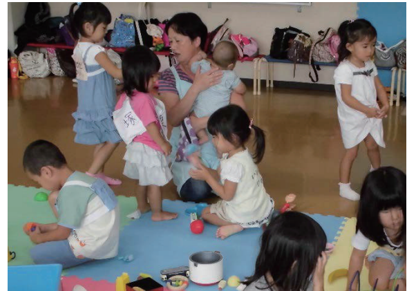
児童館での活動の様子(イメージ)