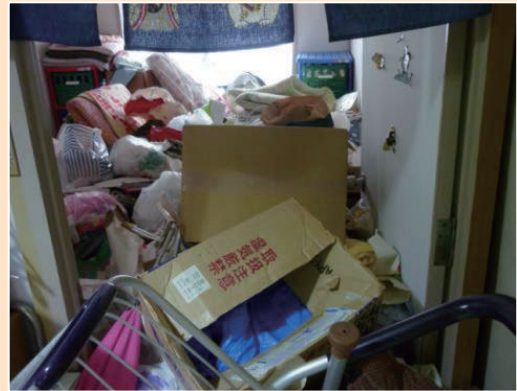
女性の自宅(片付け前)