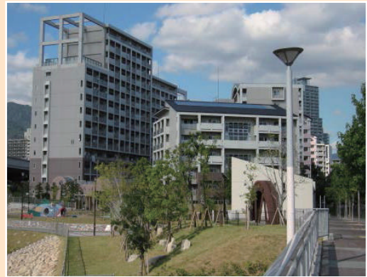
災害復興住宅HAT脇の浜

HAT脇の浜は街の西側に位置し、東西に走る道路の北側の災害復興住宅と南側の分譲住宅などからなる。また、中央には高齢者福祉施設が配置されている。