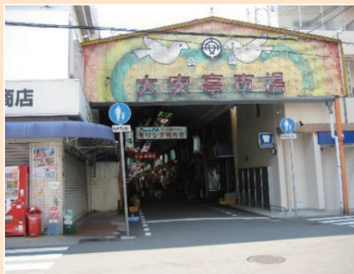
吾妻地区大安亭市場

中央区では平成23年度から地域福祉ネットワーク事業を開始したが、その初年度に吾妻地区をモデル地区に指定。地域で気軽に相談できる場として『何でもいうてや』と名付けた相談窓口のほか、そこに寄せられた様々な課題を解決するために定期的に地域福祉ネットワーク会議を開催している。