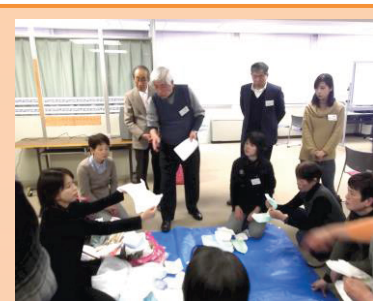
熱心に受講中です