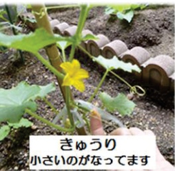
きゅうり 小さいのがなってます