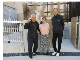
運営ボランティアさん

ご協力いただきました、西落合ふれあいのまちづくり協議会の皆さま、出演ボランティア、運営ボランティアの皆さま、そして地域の皆さま、ありがとうございました ♪ 動画も是非ご覧ください。