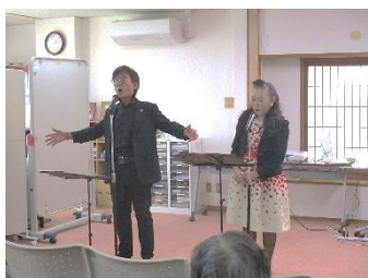
愛（まな）ミュージック・アカデミー

「感想」 とても温かいギターとハーモニカの演奏で素晴らしかったです。何より雰囲気づくりがステキでした。観客の皆さまの歌声が響きわたり、「歌」って良いなあ…としみじみ感じました。